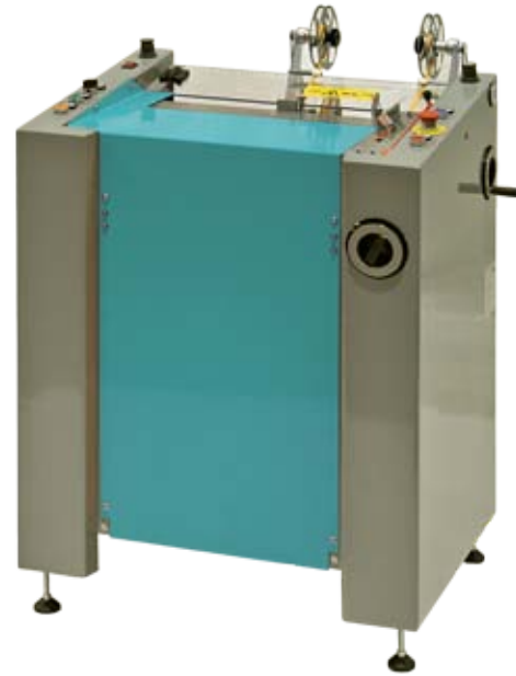
Q-BAND TWO A doppia testa, su basamento.